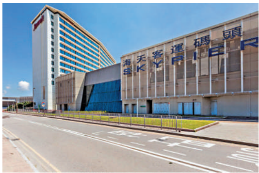
▲機管局在大灣區沿岸城市設置碼頭，把不同地區的市民和旅客，用船運載至位於香港機場島上的海天客運碼頭。

航空方面，目前有「經珠港飛」安排，內地旅客可經由「珠海機場—港珠澳大橋—香港機場」飛往國外，國際旅客可經由「香港機場—