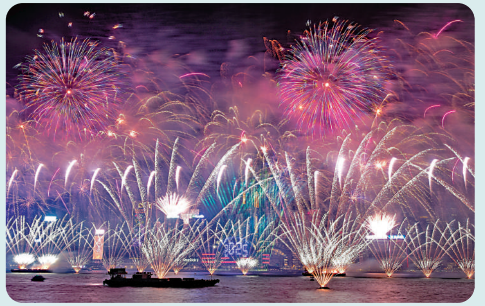
▲一月一日零時，維多利亞港上演煙花匯演，迎接二〇二五年的到來。

送舊迎新的兩項盛事活動，為新的一年開了好意頭，這是政府各部門用心做事、社會各界攜手合作貢獻民間力量的成果。二〇二五年對於香港振興經濟具有關鍵意義，有挑戰有壓力亦有機遇。特首李家超元旦賀詞以「改革求變，守正創新」為題，聚焦兩大目標。兩大盛事成功舉辦或可提供啟示：只要上下團結、官民齊心，盛事香港必定變成魅力香港，東方之珠必定更加璀璨奪目，大放異彩。