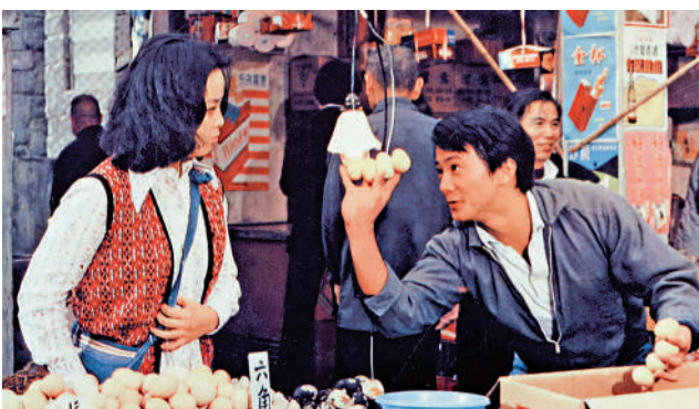
◀《奇人奇事奇上奇》(1979)劇照。

另一部作品《勾魂艷鬼》（1974）的故事講述恬妮飾演的鬼女以美色和法力引誘棺材店老闆與她合作，將不義之徒從鬼門關前救回。當棺材店老闆發現他所救的人繼續為禍人間而良心發現時，他拒絕再與女鬼合作。電影將靈幻、惹笑與香艷