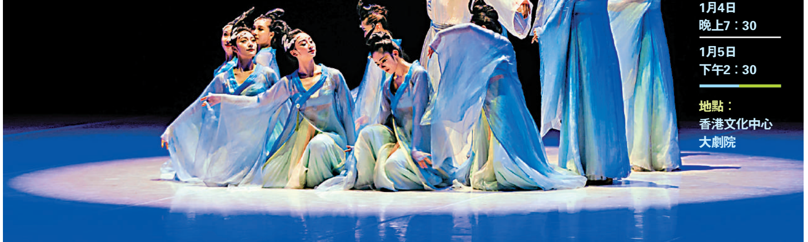
▶中國歌劇舞劇院經典舞劇《李白》。