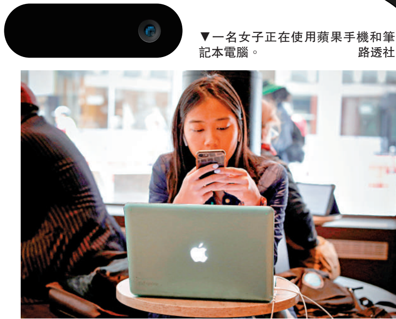
▼一名女子正在使用蘋果手機和筆記本電腦。

美國科技巨頭蘋果公司的電子設備語音助理Siri被指控偷聽用戶對話內容，涉嫌侵犯用戶隱私被起訴。美媒1月3日報道稱，蘋果公司已於2024年12月31日初步同意支付9500萬美元（約7.4億港元），以和解這項集體訴訟，不過這筆「巨資」僅相當於2024年蘋果運營9小時的利潤。初步和解協議已遞交加州奧克蘭聯邦法院，需要等待該案主審法官批准後生效。