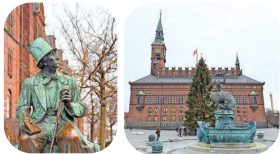
▲安徒生的雕像。 ▲哥本哈根市政廳。