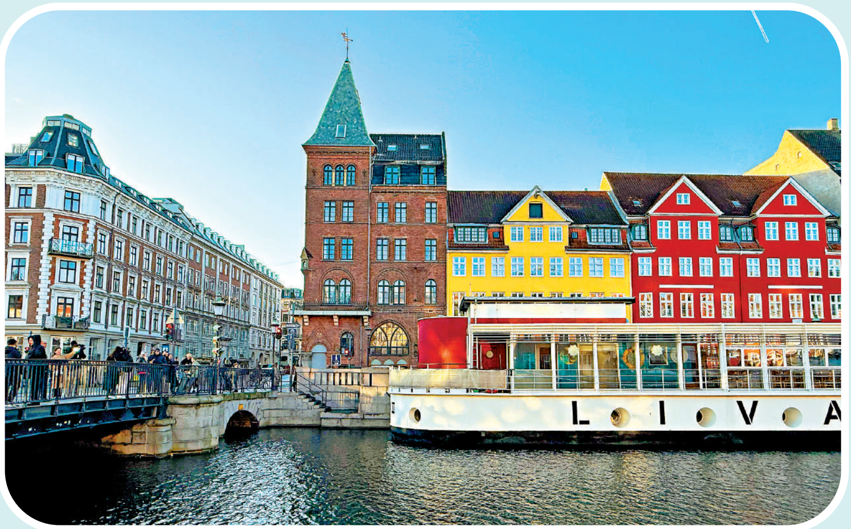
▲哥本哈根新港 (Nyhavn) 的五彩房屋，形成如畫般景致。