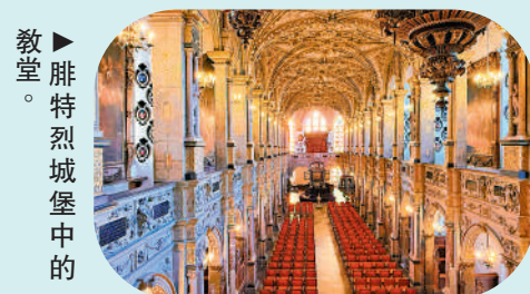
教堂。 ▲腓特烈城堡中的