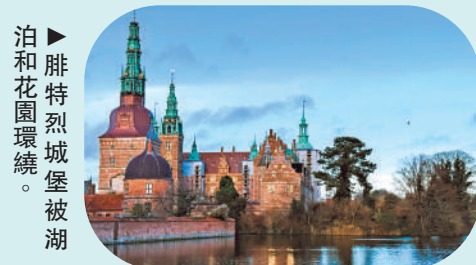
泊和花園環繞。 ▲腓特烈城堡被湖

腓特烈城堡的迷人之處，不僅在於它的建築之美，更在於它深厚的歷史內涵與文化意義。漫步於城堡之間，感受那古老與現代交織的氛圍，彷彿穿越時空。