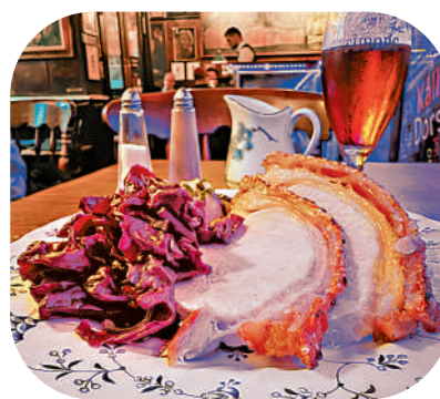
▲丹麥「國菜」脆皮烤豬肉。

丹麥美食作為北歐餐館中遊客口碑最高的存在是有一定道理的，畢竟曾獲世界排名第一的米芝蓮三星餐廳 Noma 就在哥本哈根。雖然已在2024年底永久歇業，但將以 Noma 3.0 開啟新篇。