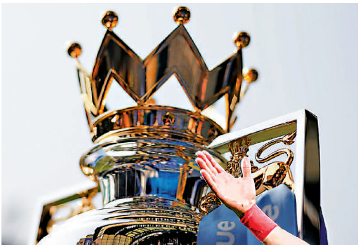
▲利物浦今季有力重奪聯賽錦標。