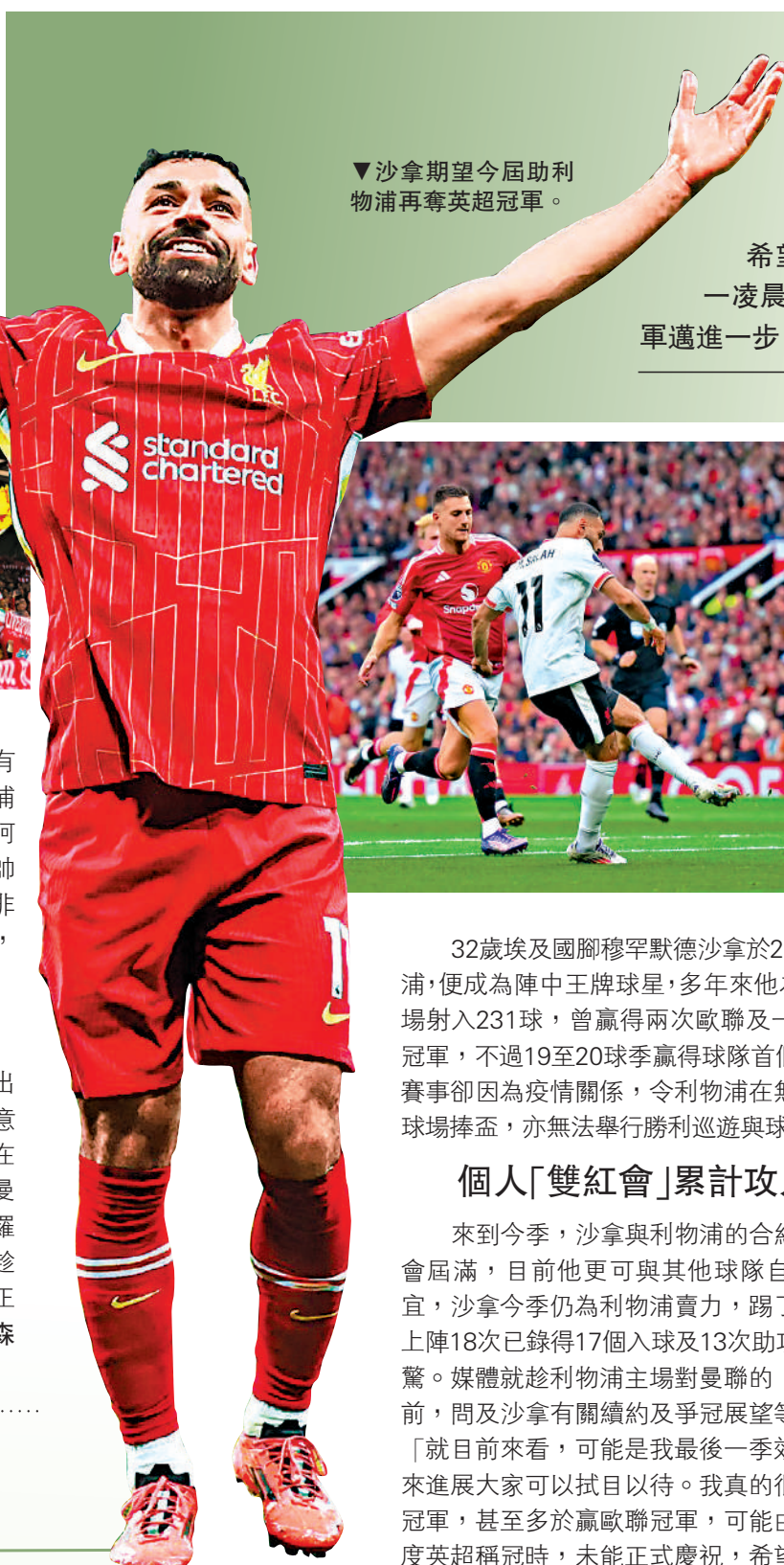
▼沙拿期望今屆助利物浦再奪英超冠軍。