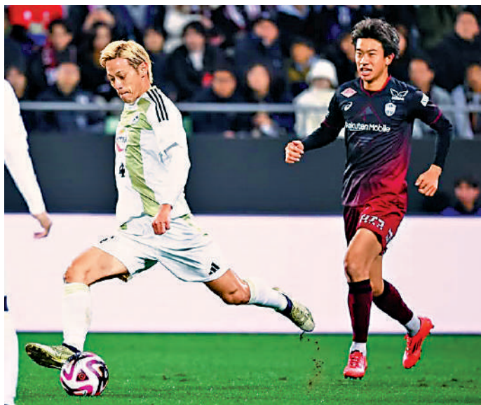
▲本田圭佑（左）的左腳重炮令球迷津津樂道。

作為前日本國家隊主力、AC米蘭名宿，本田圭佑過去曾兩度以不同身份訪港，他曾於2008年北京奧運外圍賽代表日本奧運隊在香港大球場作賽，並以標誌性的「無回轉」重炮射破港隊門將李健十指關。至於本田圭佑第二次訪港則要到2019年，當時他以球隊高層身份帶領柬埔寨國家隊來港進行友賽。