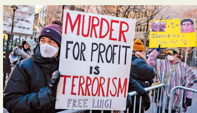
大批民眾在曼哈頓刑事法院外示威，支持曼吉奧內。