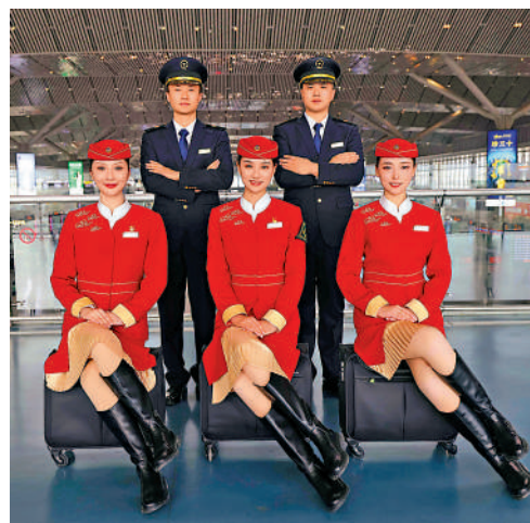
▲乘務組身著新款制服靚麗亮相。

票價(人民幣) 二等座 1157.5元 一等座 1851.5元 商務座 3887.5元