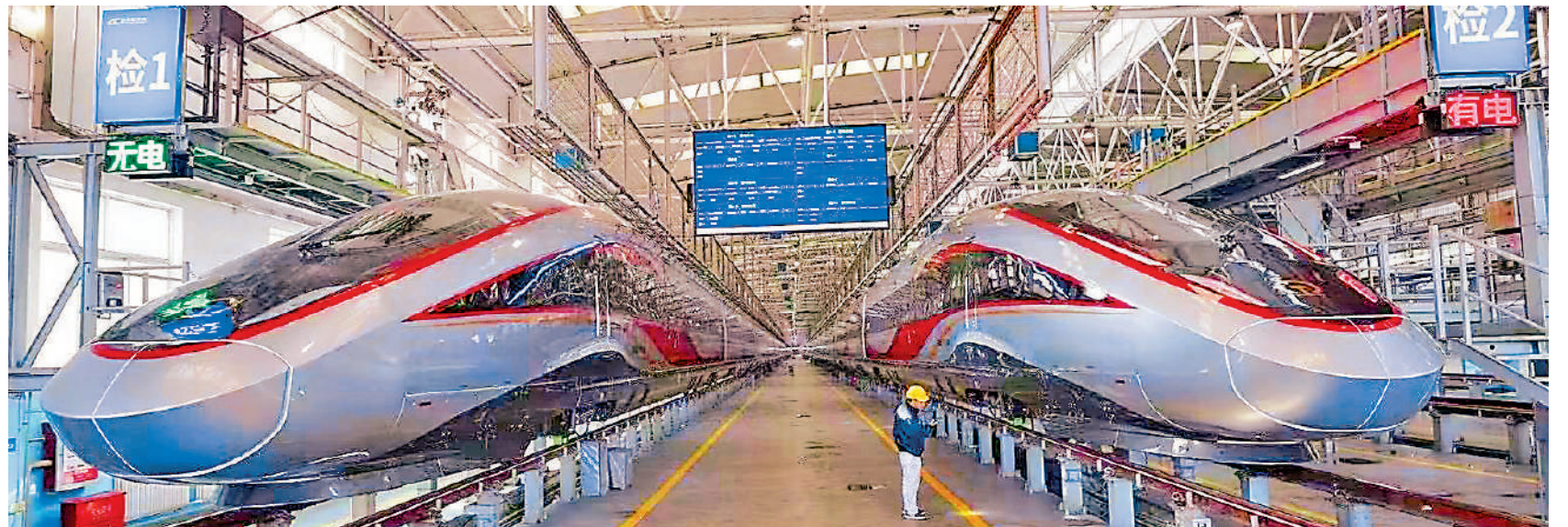
▲西安北站至香港西九龍站運輸交路由CR400BF-Z型復興號智能動車組擔當。