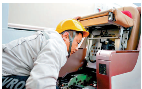
▲西安動車段工作人員在對車輛座椅進行狀態檢查。

西安高校學者黨輝教授表示，西安是古絲綢之路的起點和「一帶一路」的重要節點城市，香港是全球重要的國際貿易、航運中心和國際創新科技中心。西安至香港直達高鐵實現每日雙向對開，不僅讓兩地旅客出行將更加便捷。同時必將進一步拉近西北地區與香港的時空距離，為促進西北地區與香港在經濟、文化、旅遊等多領域的交流合作提供全新動能。