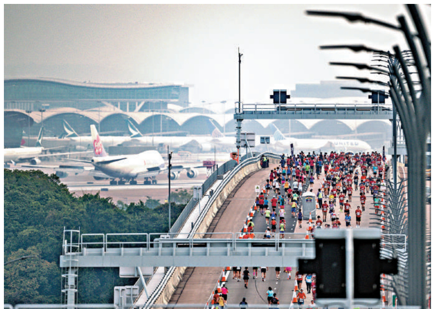
▲7000跑手在全球最長的橋隧組合跨海通道上作賽。