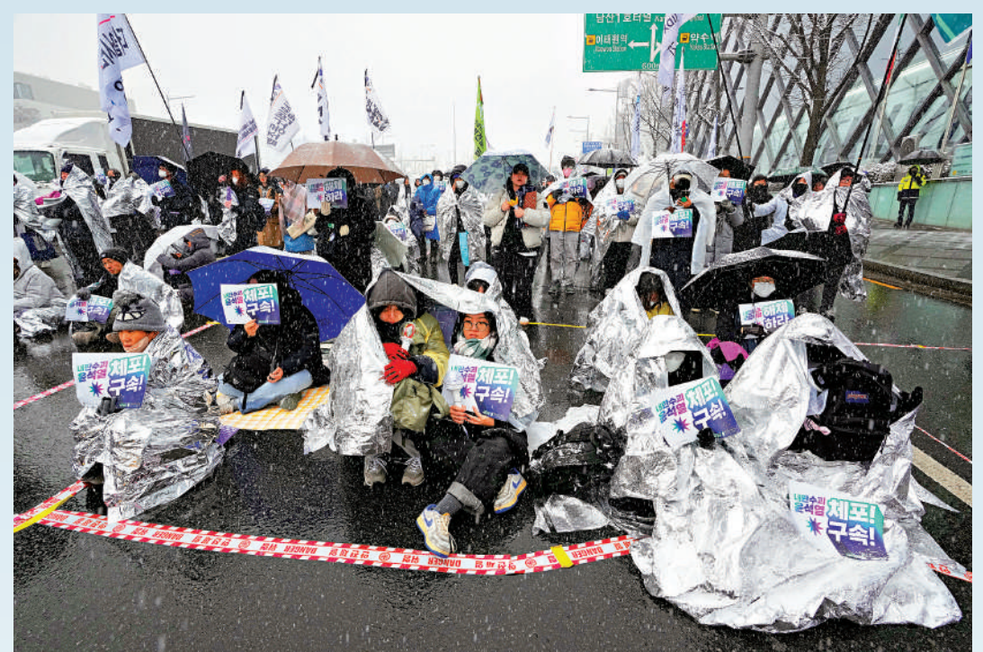
▲尹錫悅反對者5日在總統官邸附近冒雪示威，要求逮捕尹錫悅。