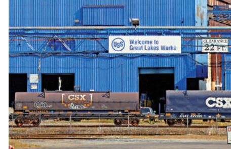
▲日鐵收購美鋼一事對美日關係造成衝擊。圖為位於美國密歇根州的美鋼工廠。

日本無限合同會社首席經濟學家田代秀敏表示，此次收購案本質上是日鐵基於利益最大化的「經濟行為」，而美方的阻撓完全出於「政治考量」。「從歷史角度來看，這是美國再一次採取貿易保護措施打壓日本。」