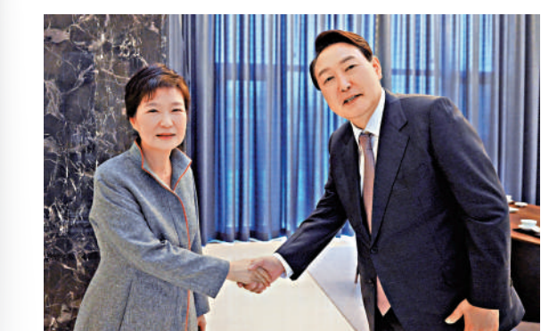
▲尹錫悅（右）2022年4月與朴槿惠會面。資料圖片

2016年10月，韓媒曝出朴槿惠閹割崔順實干預國政。同年12月，韓國國會通過針對朴槿惠的彈劾動議案，朴槿惠被停職。2017年1月，憲法法院啟動彈劾案審理程序，共舉行4次聽證會，朴槿惠始終沒有出席。2017年3月10日，憲法法院通過彈劾案，朴槿惠被罷免，失去司法豁免權；3月31日，首爾中央地方法院簽發逮捕令。朴槿惠當時在檢察院，逮捕令簽發後立即被捕。