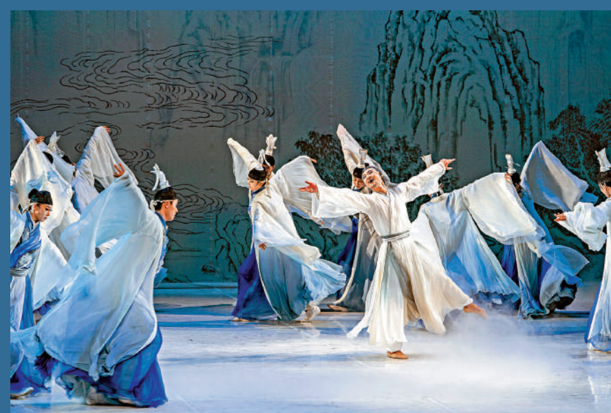
▲民族舞劇《李白》拉開2025年「國風國韻飄香江」文化演出季序幕。

劍舞飛揚，詩篇傳頌，將觀眾帶回充滿詩意與豪情的唐代。1月5日，民族舞劇《李白》在香港文化中心亮相，2025年「國風國韻飄香江」文化演出季的開年大戲由此拉開。活動接下來將組織國家大劇院的話劇《林則徐》、江蘇大劇院舞劇《紅樓夢》、中國兒童藝術劇院的兒童劇《貓神在故宮》、西安戰士戰旗雜技團雜技劇《天鵝湖》、上海歌舞團的舞劇《李清照》等8個項目來港演出，為香港市民和遊客送上一場文化大餐。