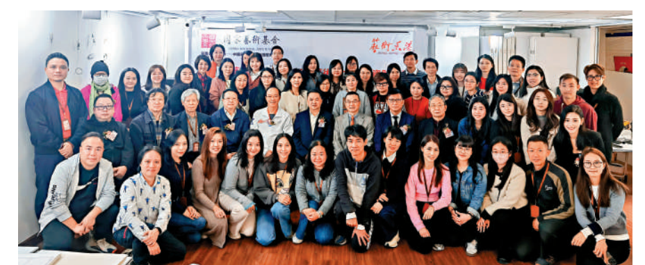
▲主禮嘉賓與學員合影。