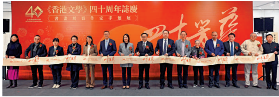
▲主禮嘉賓出席《香港文學》四十周年誌慶開幕禮。