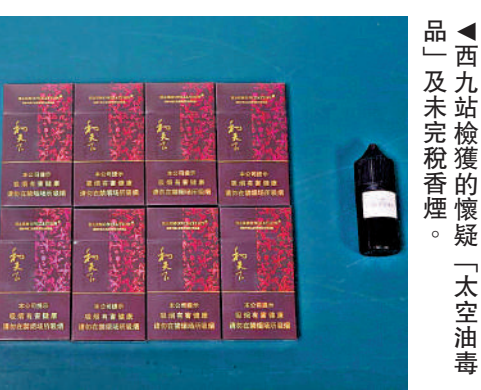
▲西九站檢獲的懷疑「太空油毒品」及未完稅香煙。