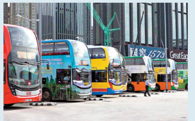
▲三間巴士公司昨日起加車費。

三間巴士公司連續兩年加價，有市民雖然對於加價不滿，認為交通支出負擔大了，百上加斤，但有需要乘搭只能說無奈，希望巴士能與市民共渡時艱，加價不要這樣頻密，並應推出回贈優惠給予市民。運輸署表示，加價已平衡對民生的影響，日常通勤路線加幅較低，約八成乘客每程加幅不超過5毫，約九成半乘客的行程，加幅為1元或以下。