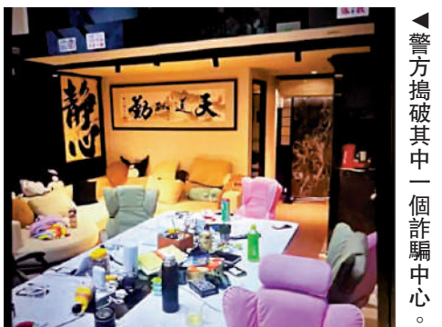
▲警方搗破其中一個詐騙中心。