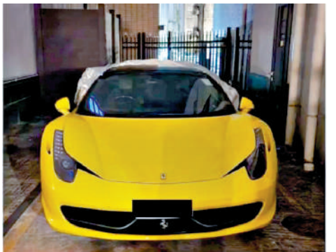
▲行動中檢獲的一輛名車。

行動中，警方檢獲超過1000萬元懷疑犯罪得益，包括逾680萬元現金、兩公斤金條、一輛名車及珠寶首飾，以及11台電腦、116部手機及一些筆記本，估算集團全年詐騙得益超過3400萬元。