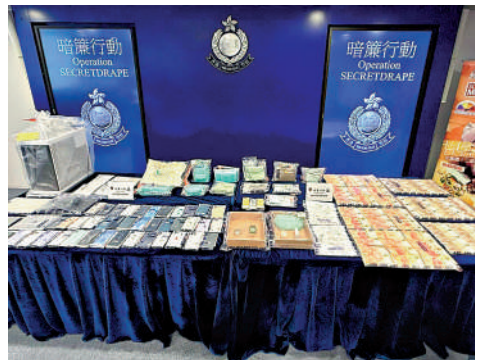
▲警方檢獲的證物及懷疑犯罪得益。