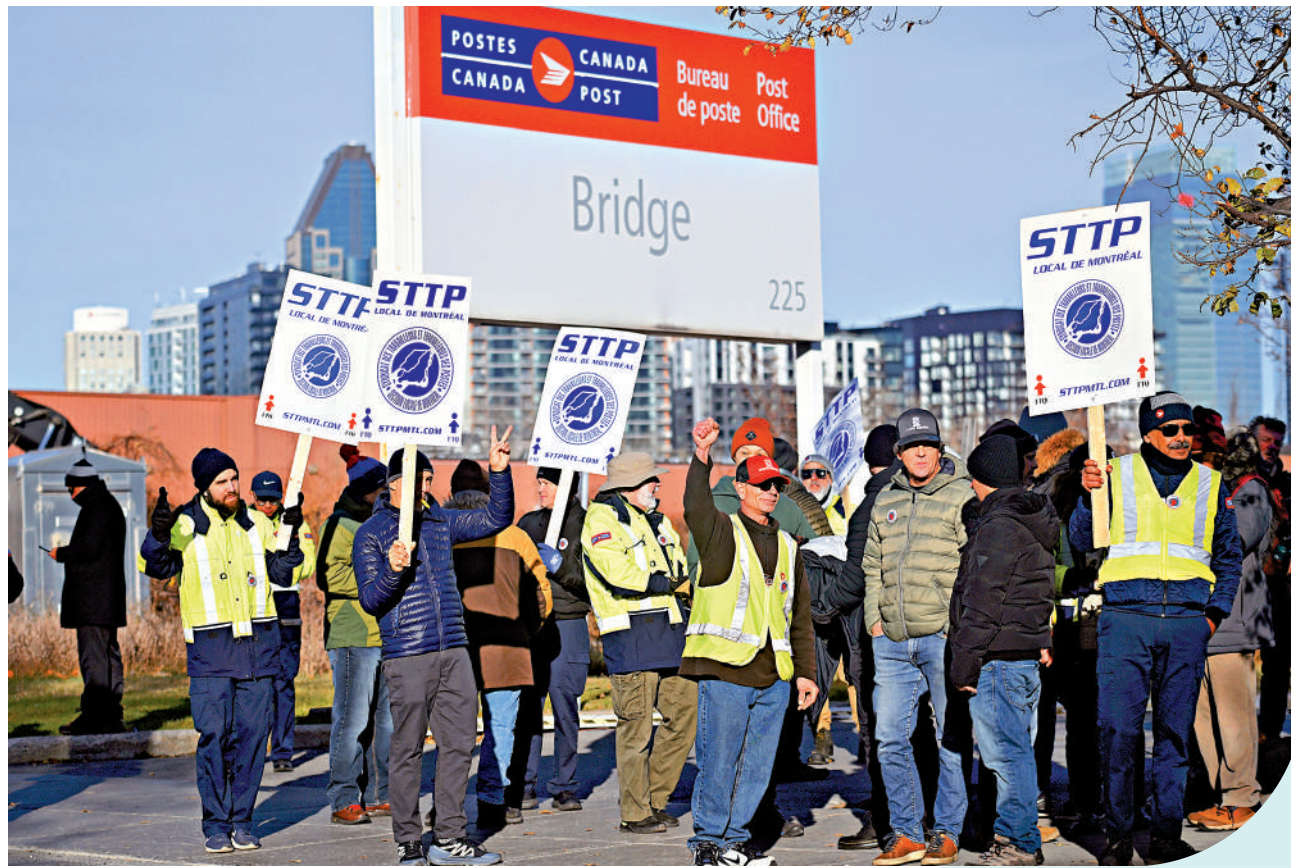
◀加拿大經濟萎靡，民眾對特魯多政府不滿。圖為加郵政工人去年11月罷工，要求加薪。