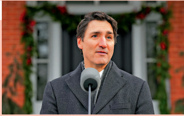
◀加拿大總理特魯多6日宣布辭任自由黨黨魁。

美國候任總統特朗普近期屢次公開調侃特魯多，稱加拿大是「美國第51個州」，特魯多是「州長」，損害特魯多在加拿大國內的威信。特朗普還威脅要對加拿大商品加徵關稅，加政府擔憂此舉將重創加拿大經濟。特魯多緊急訪美會晤特朗普，試圖解決這一問題，但無功而返。