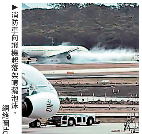
消防車向飛機起落架噴灑泡沫。網絡圖片

【大公報訊】綜合澳洲廣播公司、天空新聞報道：當地時間5日晚，阿聯酋阿提哈德航空一架從澳洲墨爾本飛往阿布扎比的波音客機在起飛時起落架冒煙，兩個輪胎爆胎。飛機緊急煞車停飛，機上289名乘客均安全疏散，沒有傷亡報告。