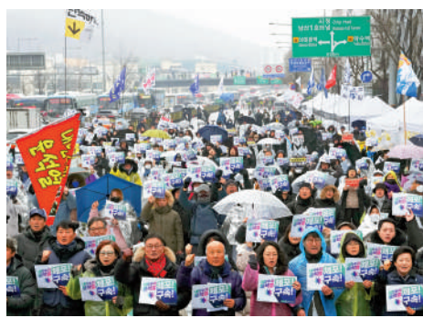
▲示威者在總統官邸附近集會，要求逮捕尹錫悅。

針對韓國總統尹錫悅的逮捕令6日午夜到期。韓國高級公職人員犯罪調查處（公調處）當天上午宣布將逮捕尹錫悅的任務移交警方，但警方隨後稱公調處發送的公文「存在法律缺陷」，難以遵從。公調處還表示，將向法院申請延長逮捕令。與此同時，韓國總統警衛處不斷加強戒備，在總統官邸外設置帶刺的鐵絲網，又用多輛巴士築起屏障，防止執法人員進入。