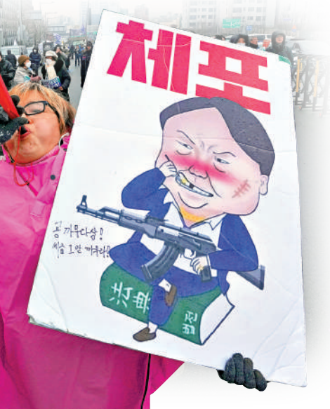
▶一名示威者高舉寫著「逮捕尹錫悅」的標語。

稱，經過內部「法理考量」，認為公調處發送的公文「存在法律缺陷」，警方難以遵從，又稱6日當天抓捕尹錫悅存在「現實困難」。韓聯社稱，這實際上拒絕了公調處的委託。