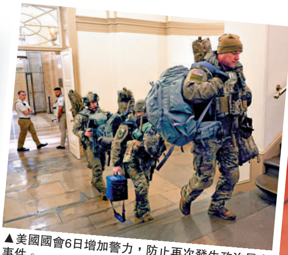
▲美國國會6日增加警力，防止再次發生政治暴力事件。