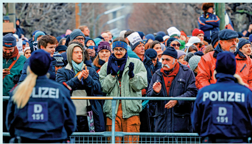
▲奧地利民眾6日在總統府外舉行示威，反對極右翼執政。

閣，奧地利必須重新舉行大選。根據目前的民調數據，自由黨的得票率將上升約7%。自由黨在去年9月舉行的奧地利國民議會選舉中首次成為議會第一大黨，但所獲議席未過半數。由於當時第二大黨人民黨等主要政黨拒絕與自由黨合作，范德貝倫授權內哈默組閣。德國將於今年2月23日提前大選，主流政黨擔憂奧地利政局變化將令德國極右翼勢力受益。德國極右翼政黨選擇黨支持率正在上升，6日公布的一項最新民調顯示，該黨支持率排名第二，達到21.5%，僅次於在野的聯盟黨；德國總理朔爾茨領導的社民黨支持率下滑至15.5%。