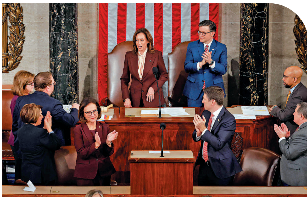
▲美國國會6日正式確認特朗普贏得2024年總統選舉。

美國國會6日點數選舉人票，正式確認特朗普當選美國總統。此次認證程序看似平靜，實則暗流湧動。4年前的暴亂事件陰霾仍在，美國國會此次特意修改認證規則，並加強安保工作。美媒表示，特朗普開啟第二任期後，美國政治極化問題恐進一步惡化。國際諮詢機構歐亞集團6日盤點2025年全球十大政治風險，特朗普的名字多次出現，其在關稅、移民等方面的政策將對美國乃至全球造成負面影響。