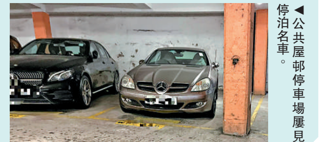
公屋車位停車場屢見停泊名車。

房委會現時有透過免費郵東、網上電子表格、電郵和舉報熱線等不同途徑，收集濫用公屋情報。2023/24年度，以實名舉報可供跟進濫用公屋的個案，有約1300宗。房署數據顯示，透過舉報找出住戶擁有住宅物業的比例，約有1.5%，而透過公屋住戶申報並於土地註冊處作配對後發現購報的比例為0.5%，兩者相差3倍，顯示舉報可提供更好線索。