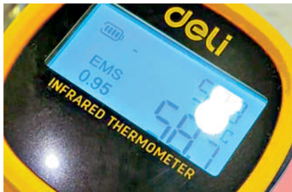
▲▲大公報記者到元朗一間茶餐廳實測，發現飲用水水溫達58°C，需要花兩元買一杯冰降溫。