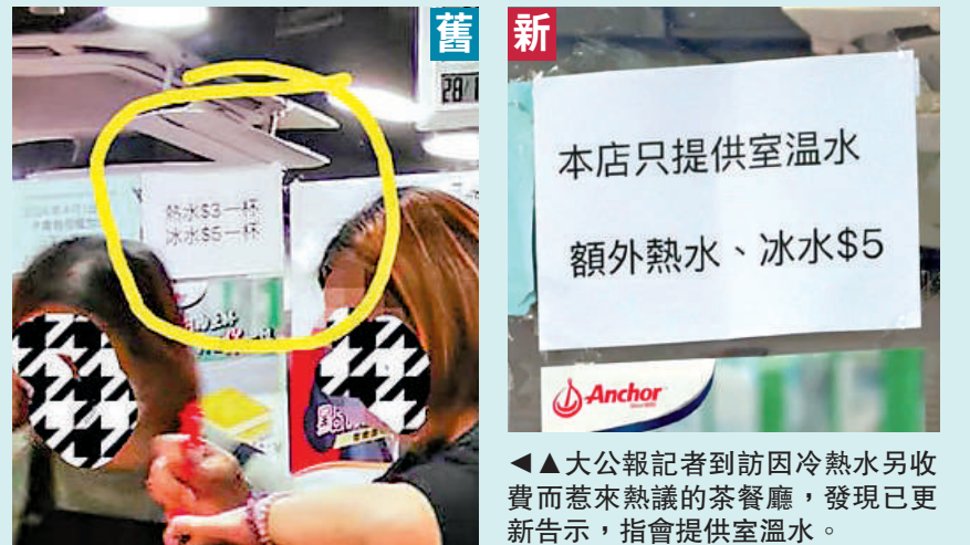
▲▲大公報記者到訪因冷熱水另收費而惹來熱議的茶餐廳，發現已更新告示，指會提供室溫水。

務，因一杯可入口的常溫水是方便長者及小童飲用，他們未必點餐飲，但亦有顧客寧願茶餐廳免費提供滾水，方便他們用餐前洗滌餐具。姚柏良議員指冰塊有成本需要額外付錢是可理解，但香港的茶餐廳免費贈食客一杯飲用水是多年傳統，亦形成地道文化，若茶餐廳刻意提供滾水，令食客不得不額外付錢買冰降溫，影響觀感可能得不償失。他指出對旅客而言，送一杯水予旅客體驗良好，贏得口碑，賺了回頭客甚或獲得網民推介宣傳，對飲食業有更大幫助。