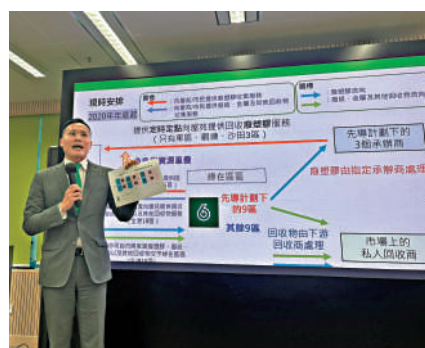
示。環保署助理署長黃智華表示，新安排不會影響市民回收。

半個香港的「綠在區區」廢膠回收，每噸可獲政府4700元補貼，而非計劃覆蓋地區的「綠在區區」則需用自身營運費，支付下游回收費用，造成資源錯配。中標回收商亦搶佔其他不在計劃下的「綠在區區」市場，造成業界不公平競爭。政府取消先導計劃令回收市場更公平。據他了解，現時下游回收商都在搶佔市場，向「綠在區區」報出的回收價少於4700元一噸，甚至平近一半，「有些不在先導計劃下的回收商都捱了這麼多年，不認為這些先導計劃下的回收商會因為取消計劃而無法營運」。