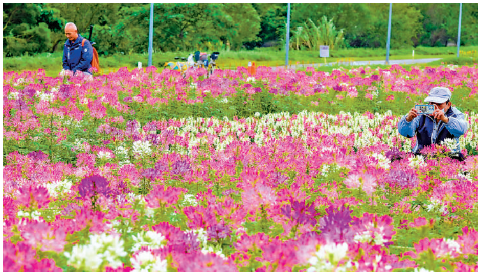
冬季花海 台北古亭河濱公園以多達33725株白色及粉色的醉蝶花及矮牽牛、一串紫、石竹、紫鳳凰、鼠尾草、羽葉薰衣草等花卉，打造冬季花海，民眾可以在花田間野餐、散步、騎車。

民眾黨議員陳世軒則表示，「一旦進入大罷免時代，代表全年都在罷免宣傳，不只勞民傷財、耗費社會成本，社會更充斥憤憤氣氛」。2022年「立委」林昶佐罷免案經費約1500萬元新台幣，以此計算罷免全台不含原住民的73席區域「立委」，恐耗掉超過11億元新台幣。