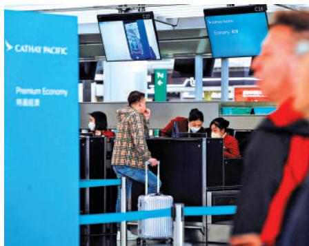
▲國泰去年新增7000名員工，截至去年底員工總數超過3萬人。

貨運方面，劉凱詩透露，去年集團貨運表現相當強勁，增長主要來自腹艙運力的增加以及電子商務需求的推動，特別是來自中國內地的需求。目前沒有跡象顯示貨運需求會有所減弱，但因剛經歷一段高峰時期，2025年年初可能會略顯平穩。