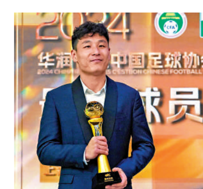
武磊當選本賽季中超最佳球員和最佳射手。

裁判員獎項方面，主裁判唐順齊、李海新和馬寧分獲金、銀、銅哨，助理裁判施翔、馬濟、劉星分獲金、銀、銅旗。