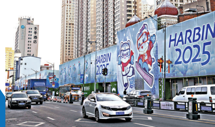
在哈爾濱道外區景陽街，車輛駛過巨幅亞冬會宣傳畫。

亞冬會之最。高山滑雪項目有25個國家和地區報名，是報名最踴躍的項目，其中包括新加坡、泰國、馬來西亞，以及西亞地區的科威特、阿聯酋等。這些體現了近年來，特別是北京冬奧後，亞洲冰雪運動的快速發展。亞冬會是國際奧委會承認的亞洲地區冬季綜合性運動會，也是亞洲地區規模最大的冬季綜合性運動會。該賽事由亞洲奧林匹克理事會主辦，通常每四年舉辦一屆。自1986年起，亞冬會已經成功舉辦8屆。在1996年，第3屆亞冬會的舉辦地就是哈爾濱。