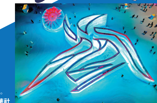
亞冬會會徽冰雕。