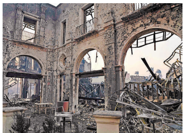
▲一幢房屋在帕利塞茲山火中付之一炬。

限制在加州提供保險的多數保險公司，都提到山火風險不斷升高是他們做出這個決定的主要原因。這引發加州目前的房屋保險業危機。報道稱，由於此次南加州地區多起山火同時發生，許多居民可能必須依靠保險才能恢復生活。