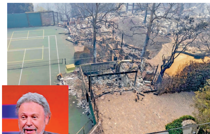
▲著名喜劇明星比利基斯圖(左圖)的房子已被燒毀。

美國總統拜登8日在洛杉磯聖莫尼卡消防站聽取關於山火的簡報，隨後他向媒體公布自己的「好消息」：他的孫女納奧米·拜登誕下一名男嬰，成為曾祖父。不少美國網民批評他在這樣的場合宣布個人喜訊，認為他對山火災情漠不關心。拜登已經取消了原定9日至12日訪問意大利的行程，這也是他任內的最後一次外訪計劃。(綜合報道)