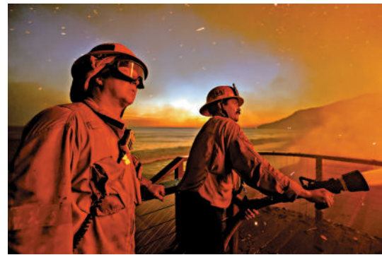
▲消防員奮力灑水救火。