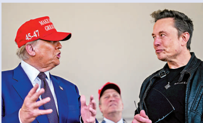
▲ 馬斯克（右）在社媒大肆抨擊與特朗普立場不同的歐洲領導人。

【大公報訊】綜合《金融時報》、《華爾街日報》報道：美國候任總統特朗普的親密盟友、億萬富豪馬斯克近日通過社交媒體攪動歐洲政壇，對德、法、英等國主流政黨展開攻擊，引發軒然大波。英媒9日分析稱，特朗普和馬斯克正在歐洲全面布局，拉攏右翼和民粹主義政黨，並公開打壓中左翼政黨，表現出明顯的尋覓「戰友」、打壓異己的特徵。馬斯克在社交平台X上抨擊英國工黨首相斯塔默，稱其擔任檢察官期間未能妥善處理性虐未成人案件，並要求他下台；德國聖誕市集襲擊事件發生後，馬斯克要求德國總理朔爾茨辭職，並公開支持德國極右翼政黨選擇黨。