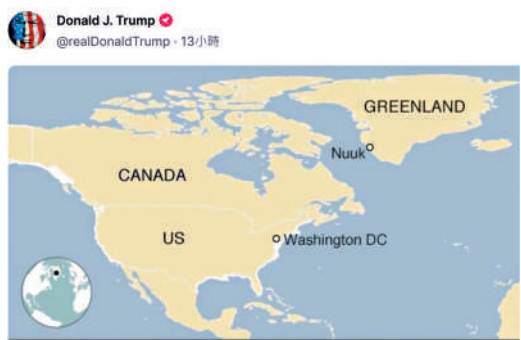
▲ 特朗普繼續撥火，上傳用同樣顏色標註美國、加拿大和格陵蘭島的地圖。