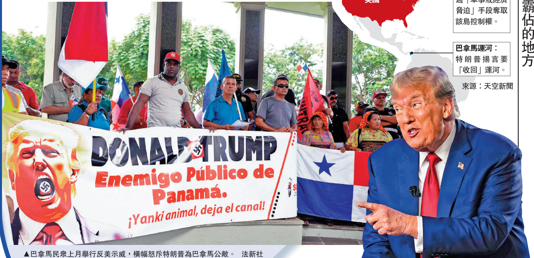
▲ 巴拿馬民眾上月舉行反美示威，橫幅怒斥特朗普為巴拿馬公敵。