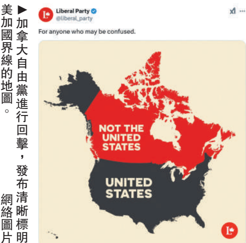
▲ 加拿大自由黨進行回擊，發布清晰標明美加國界的地圖。

【大公報訊】特朗普7日在記者會上聲稱，不排除通過「軍事或經濟脅迫」手段奪取巴拿馬運河和格陵蘭島控制權的可能性。他還說，對使用「經濟力量」收購加拿大持開放態度。特朗普7日在其自創社交平台Truth Social發布「加拿大併入美國」之後的所謂「美國全新版圖」，8日又上傳一張BBC報道中的地圖，圖上格陵蘭島、加拿大和美國均用統一的黃色標記。