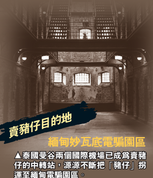
緬甸妙瓦底電騙園區