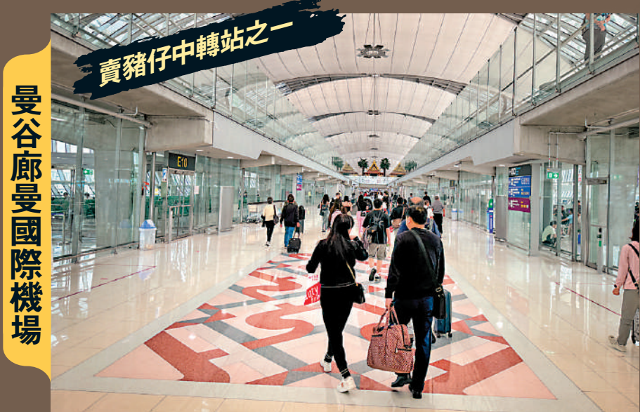
曼谷廊曼國際機場