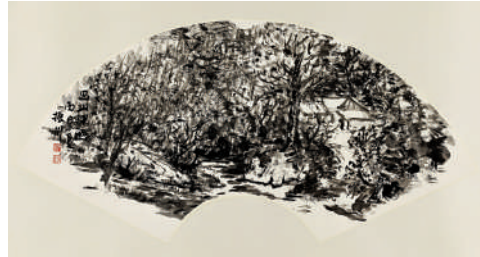
《巴山深幽》，趙振川，扇面，2016年。