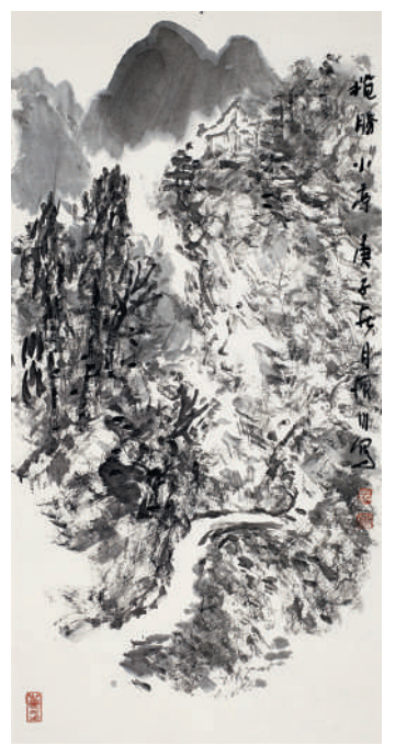
《流水崖歸牧》，趙振川，宣紙，2020年。