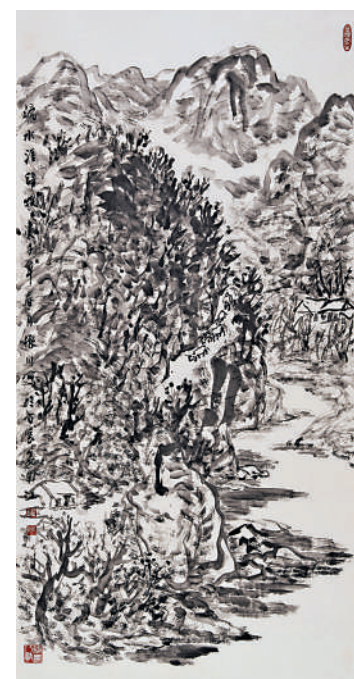
《攬勝小景》，趙振川，宣紙，2020年。