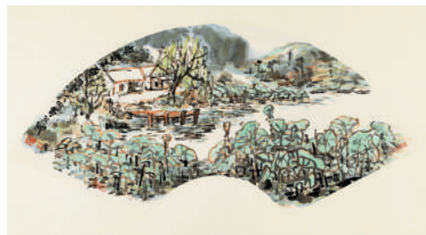
《荷塘秋趣》，趙振川，扇面，2012年。