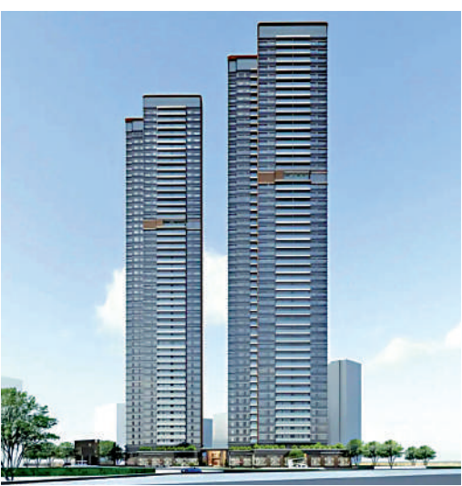
▲中海江泰里共兩幢住宅樓，配套設施成熟。

計，總價430萬元。至於105平米四房戶型，以南向6米大露台、主人套房3米窗台和6米開間的客廳，為家庭提供更加舒適的居住選擇，總價在550萬至600萬元之間。