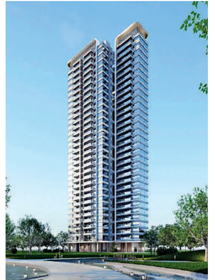
▲中建·天鈺以便利的交通與成熟的生活配套為賣點。