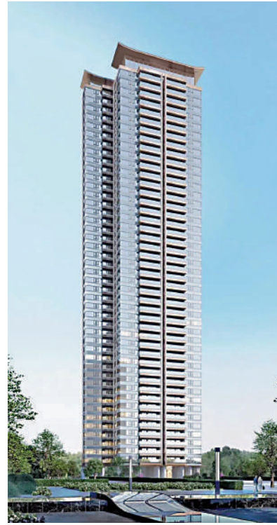
▲保利·燕語堂悅樓價相對廣州中心區周邊樓盤親民，性價比高。