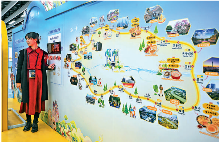
▲廣州地鐵11號線設有31個車站，其中26個為換乘站。