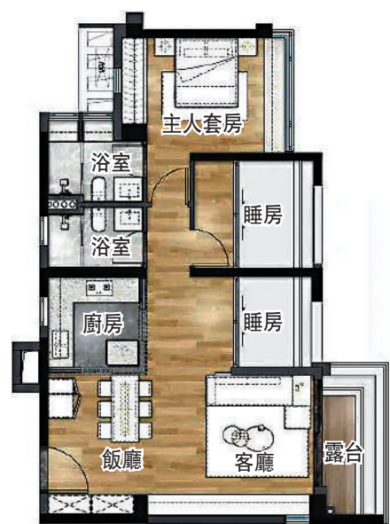
▲中海江泰里82平米三房兩廳戶型圖。