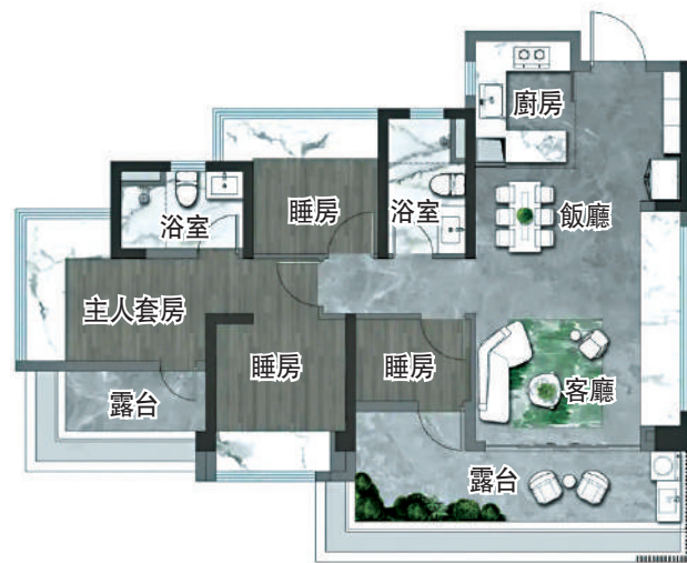
▲中建·天鈺100平米四房兩廳戶型圖。