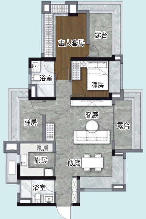
▲保利·燕語堂悅90平米三房兩廳戶型圖。