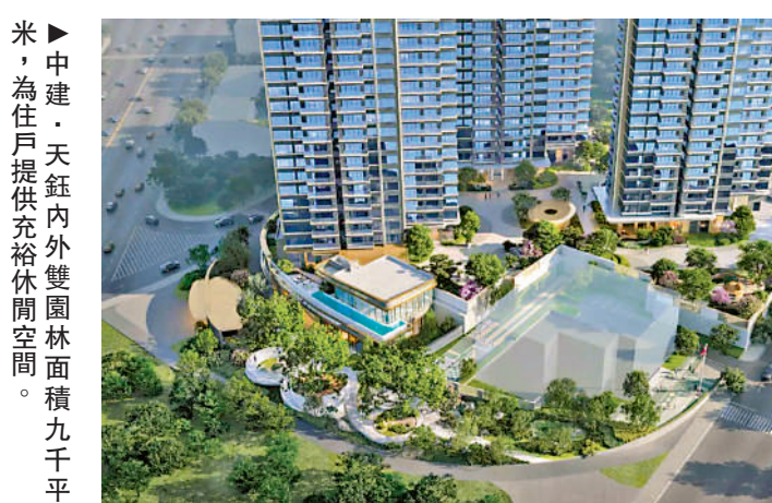
▲中建·天鈺內外雙園林面積九千平米，為住戶提供充裕休閒空間。

中建·天鈺自帶一所幼兒園，周邊還有紅棉小學、培紅小學等優質教育資源，以及多所中學，為有教育需求的家庭提供更多選擇。同時，項目周邊擁有南方醫科大學珠江醫院、中山大學孫逸仙紀念醫院等多家醫療機構，無論是教育還是醫療資源都十分豐富。