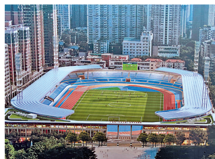
▲廣東省人民體育場將充分融入街區，圖為場館升級改造後的效果圖。