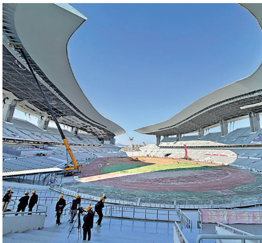
▲廣東奧體中心體育場設置架空層，既增加了公共空間，又實現節能降耗。

全運熱話 在第十五屆全國運動會（下稱十五運）開幕式倒計時300天（1月13日）前夕，記者來到承擔十五運重要賽事的廣東奧體中心、廣東省人民體育場、越秀山體育場探營，實地了解場館的建設、運營情況。走訪中發現，這些場館均有着深厚的歷史文化積澱，在繼承保留原有風貌、風格的同時，廣泛進行綠色、低碳、智慧以及無障礙升級，老場館煥發出新生機。在升級改造中，團隊與港澳方面充分交流，借鑒經驗，使得場館體現嶺南風格、灣區特色。