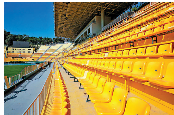
▲越秀山體育場已經完成改造並交付，15日舉行的省港盃足球賽，將是測試賽。

15日，第43屆省港盃首回合比賽將在越秀山體育場舉行，屆時也是該場館的首場測試賽。