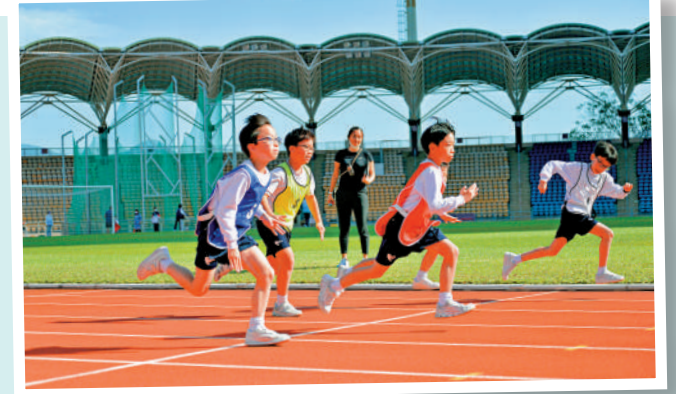
▲世衛建議學童每日要做60分鐘中等至高強度的體能活動。

【大公報訊】記者郭如佳報道：體適能總會及港大團隊合作研究學童體能狀況，顯示只有不足8%本港學童的體能活動時間達世衛標準，每日中等至高強度體能活動不足60分鐘，其中中學生達標率低至2.7%。反映前臂肌力的手握力，相比內地、中東及南亞等地區，本港學童的手握力最弱。