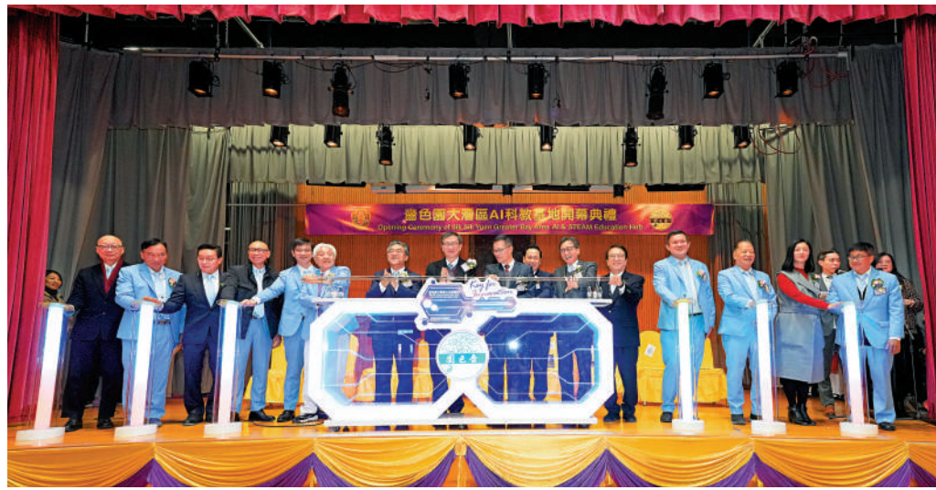
▲一眾嘉賓為「薈色園大灣區 AI科教基地」主持啟動儀式。

近年，薈色園屬校致力於科技及AI教育，建立「科創校園」，設有STEAM學習室與「智能水耕研習室」等。隨着低空經濟的興起，亦增設機械人及無人機課程。薈色園相信AI科教基地可以促進大灣區內的師生在AI及科創方面的學習交流，培養更多的科創人才。