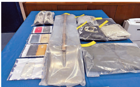
▲警方檢獲犯案用的冰鏟，以及兇徒身穿衣物。

干犯暴力罪行，予以嚴厲譴責。警方對所有黑社會有關活動，繼續採取零容忍態度，會繼續將不法分子繩之於法。