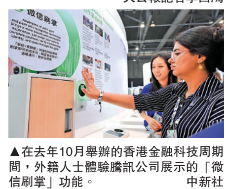
▲在去年10月舉辦的香港金融科技周期間，外籍人士體驗騰訊公司展示的「微信刷掌」功能。

達到2.47億元人民幣。深圳數據交易所將配合國家數據局推動可信數據空間發展行動計劃，探索建設跨境電池、保險、能源、車輛等領域的數據空間。