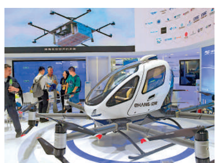
▲數據產業有望成為數字經濟新增長點。圖為珠海航展上展示的億航無人駕駛載人航空器。

深入推進數實融合的同時，數據產業有望成為數字經濟新增長點。相關部署提出，到2028年形成不少於100個數據空間解決方案和最佳實踐，帶動擴大基礎設施建設投資。到2029年數據產業規模年均複合增長率超過15%。國家數據局副局長陳榮輝近日在發布會上表示，未來將重點推動數據產業與無人駕駛、具身智能、低空經濟等數據密集型產業融合發展，加速數智融合技術創新，在未來產業競爭中加快謀篇布局、搶佔發展先機。