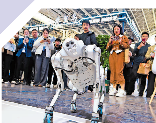
▲在2024中國國際數字經濟博覽會期間，智能機器狗吸引參觀者。