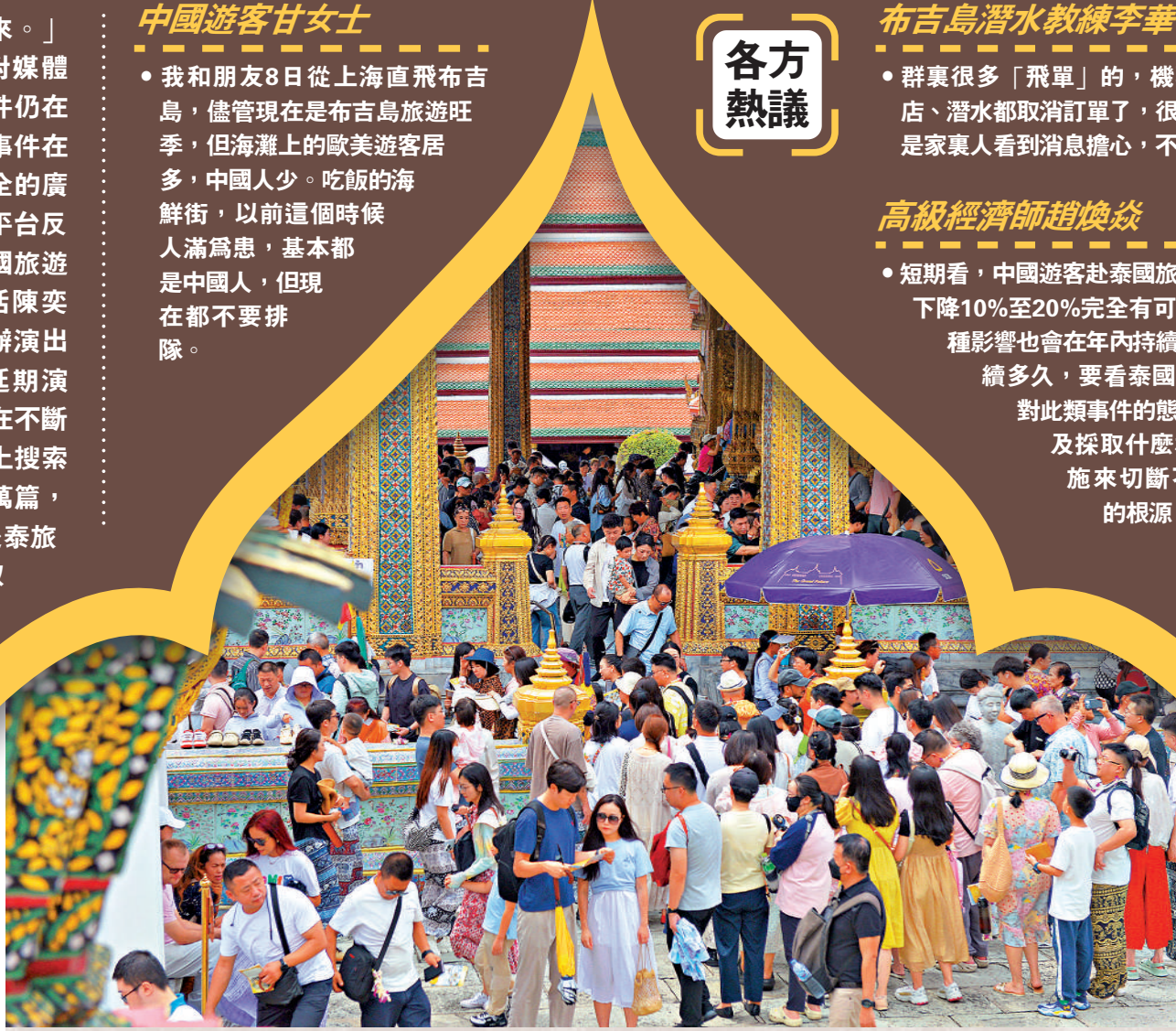
▲長期以來，泰國都是中國遊客最愛的東南亞旅遊目的地之一。圖為去年10月，中國遊客在泰國曼谷大皇宮遊覽。

長期以來，泰國一直是中國遊客最愛的東南亞旅遊目的地之一。數據顯示，2024年有超過3500萬人次的外國遊客抵達泰國，在該國的消費超過1.6萬億泰銖（約3400億元人民幣）。其中，中國遊客最多，達670萬人次。