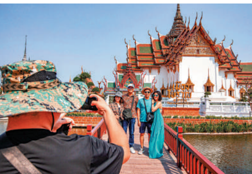
▲中國遊客在泰國北禮府羅羅古城打卡拍照。

消費提示 「我們在泰國的公司，導遊、領隊、車隊、司機，都是在泰國國家旅遊局備案過的正規工作人員，會提前拉好24小時服務的管家群。」據一位從事泰國旅遊多年的資深從業者透露，泰國國家官方高度重視這起事件帶來的影響，全部下發通知：安全系統全部升級。不少業內人士也表示，報一個正規旅遊團跟團遊泰國，還是有安全保障的。 河南澤權律師事務所主任付建表示，遊客在預訂泰國行程後取消，能否獲得退款要