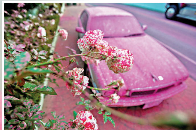
▶帕利塞茲山火席卷了洛杉磯曼德維爾峽谷社區，鮮花和汽車被阻燃劑覆蓋。