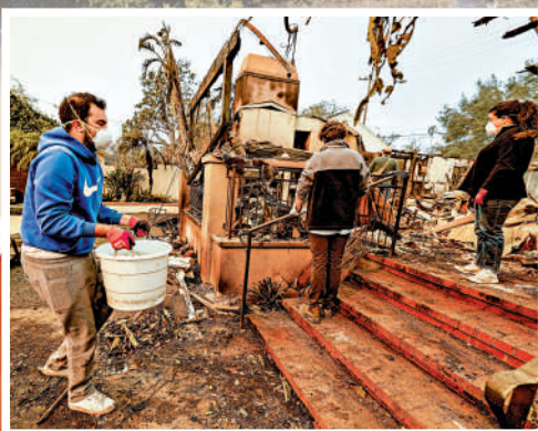
▲加州山火導致近萬棟房屋淪為廢墟。