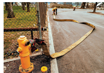
▲消防員在撲滅山火時遭遇消防栓缺水的問題。

加州大學洛杉磯分校研究水資源和城市規劃的研究員皮爾斯還提到，更根本的問題是洛杉磯諸多社區建設在城市與野外交界處，隨着氣候變化，火災發生的頻率和強度增加，這些社區更容易受到毀滅性的影響。