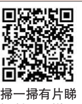
掃一掃有片睇 攝製：融媒組