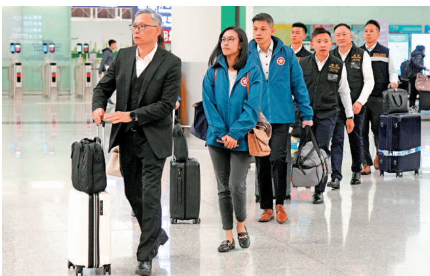
保安局副局長卓孝業昨日率領專責小組成員，前往泰國跟進非法工作的人被誘騙到東南亞國家禁錮並從事非法工作的個案。

港人被「賣豬仔」到電騙園的事件死灰復燃，新一波涉及28人，至今仍有至少12名港人被禁錮在緬甸電騙園。保安局副局長卓孝業昨日率領專責小組前赴泰國，進一步跟進有關求助個案。 專責小組今日會與中國駐泰國大使館、泰國官員會面。卓孝業昨日出發前表示，泰國政府非常重視事件，已安排「相當高級」的官員與專責小組會面。他說今次行動目標是令所有求助港人安全回港。