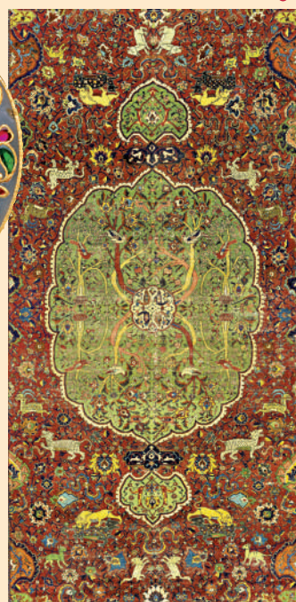
►薩法維王朝蘇萊曼沙阿一世「打獵」地毯。