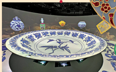
▲「『紋』以載道——故宮博物院沉浸式數字體驗展」展廳。