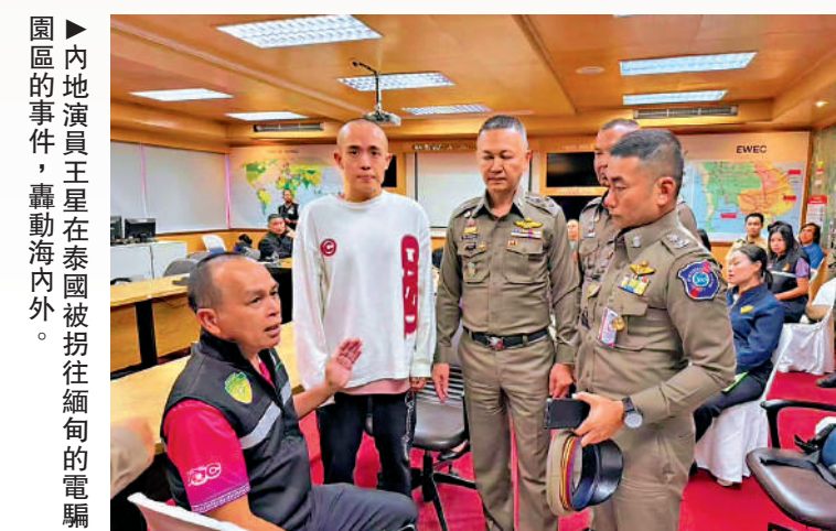
▶內地演員王星在泰國被拐往緬甸的電騙圍區的事件，轟動海內外。