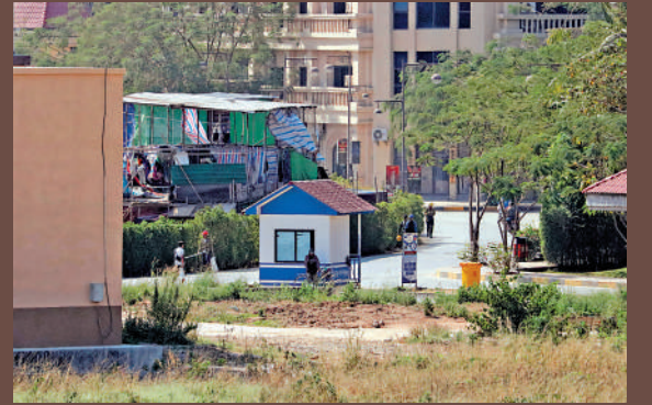
▲大公報記者連日直擊緬甸妙瓦底電騙圍區的情況。