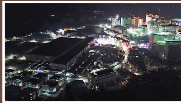
亞太城電騙園區的建築烏煙瘴氣，集中黃賭毒的部分，燈火通明，成鮮明對比。

然而時至今日，電騙早已不再只是利用電話騙人而是發展成「賣豬仔」，「豬仔」不聽話輕則遭受毒打，重則會被入摘除器官販賣，該學者認為，這樣的犯罪團夥與恐怖組織無異，各國必須正視。「電騙個案在全世界都在增加中，不只是香港，美國也有，（個案）升得好勁。」