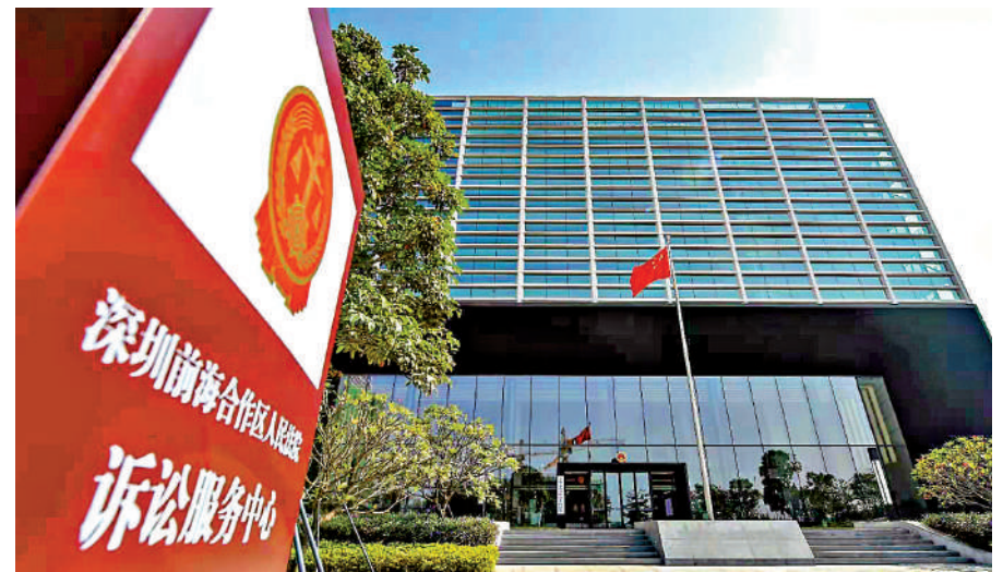
▲深圳前海合作區人民法院訴訟服務中心。