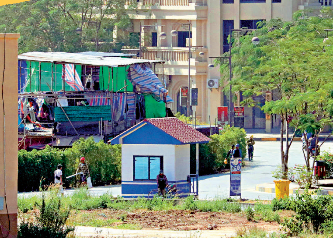
大公報記者在妙瓦底亞大城恒升園區的出入口見到有人在更亭外把守，並有多名建築工人進出。