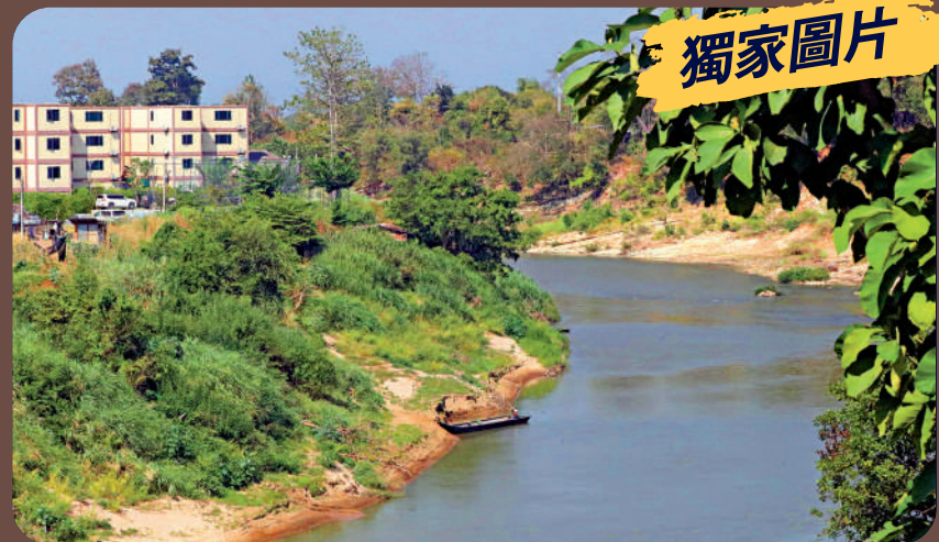
妙瓦底亞大城旁的莫艾河上停泊了小船，用作從泰國湄索偷運豬仔到亞大城。