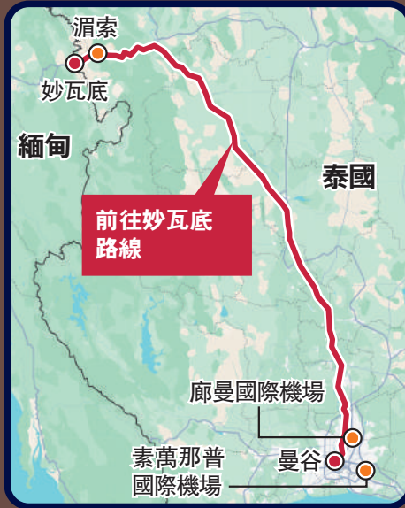
港人從曼谷機場被拐往緬甸妙瓦底路線