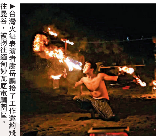
往曼谷，被拐往緬甸妙瓦底電騙園區。