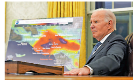
▲拜登卸任前宣布向加州提供更多援助。

美國眾議院議長約翰遜13日表示，支持為向加州提供聯邦援助設置附加條件。他並未說明是什麼條件，但批評加州政府在水資源管理和森林管理方面犯下錯誤。佛州民主黨眾議員莫斯科維茨警告說，這種做法將引發惡性循環，當民主黨控制眾議院時，佛州和得州等紅州也可能在需要聯邦援助時被刁難。