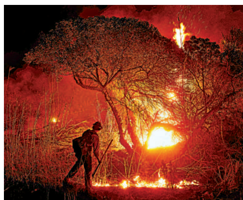
▲洛杉磯西北方向13日晚燃起新的山火。

美國加州南部洛杉磯地區山火持續燃燒超過一周，13日晚又出現一場新的山火。氣象部門警告說，13日至15日強風將再次襲擊洛杉磯，整個南加州沿海地區均面臨火災風險。災區亂象叢生，超過70人因涉嫌盜竊、搶劫、縱火等原因被捕。美國各級政府救災不力的問題日益凸顯，美媒披露，一對行動不便的父子向政府機構求助卻無人理，眼睜睜看着大火燒到家中，最終葬身火海。