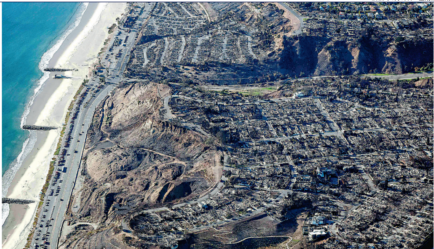
▲山火燒毀洛杉磯沿海社區，美國政府救災不力引起民憤。

美國加州南部洛杉磯地區山火持續燃燒超過一周，13日晚又出現一場新的山火。氣象部門警告說，13日至15日強風將再次襲擊洛杉磯，整個南加州沿海地區均面臨火災風險。災區亂象叢生，超過70人因涉嫌盜竊、搶劫、縱火等原因被捕。美國各級政府救災不力的問題日益凸顯，美媒披露，一對行動不便的父子向政府機構求助卻無人理，眼睜睜看着大火燒到家中，最終葬身火海。