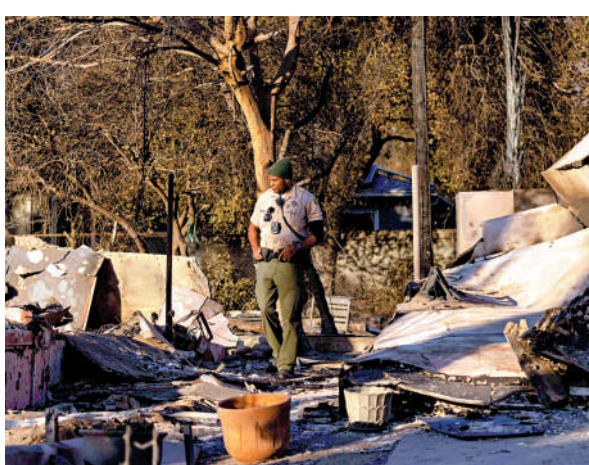
▲一名執法人員13日查看被燒毀的房屋。