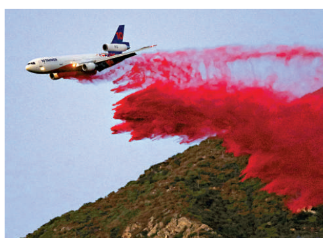
▲一架飛機13日在山火蔓延區域噴灑阻燃劑。