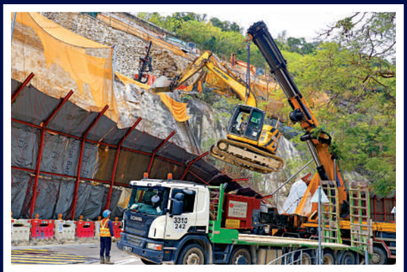
▲大型吊臂車將涉事挖泥車吊起。