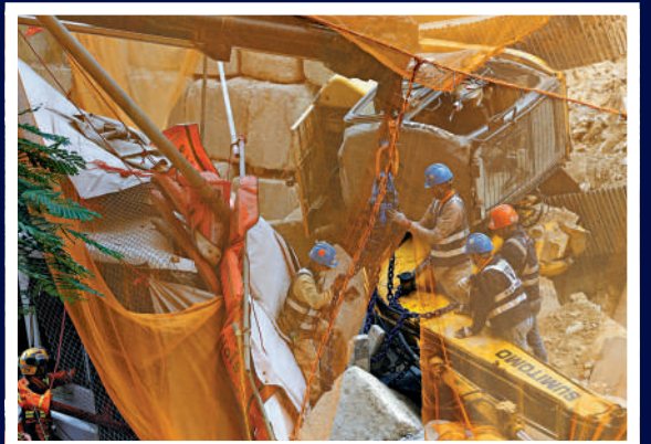
▲挖泥車重量大，增加救援難度。