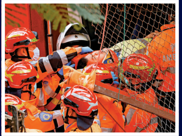
▲消防人員救出被困工人。