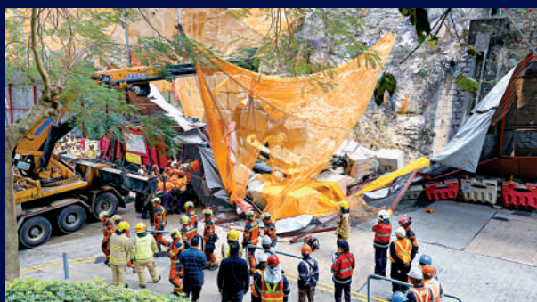
▲連德道工業意外，救援工作分秒必爭。