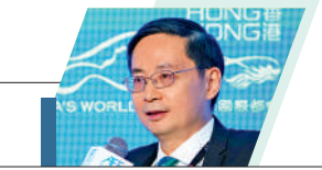
香港綠色金融協會主席兼會長馬駿

香港應該認識到，為新能源、電動車、污染防治等服務的「純綠」金融已經成為「大宗商品」，可持續金融的未來主要增長點在於轉型金融。