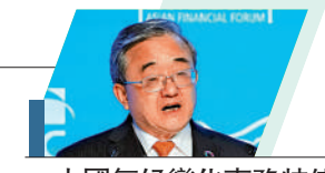
中國氣候變化事務特使劉振民

香港可促進氣候融資，包括引導氣候資金流向、擴展與內地及亞洲各國氣候金融合作及創新氣候融資工具；亦可充分利用成熟的保險市場，透過開發氣候保險產品降低投資項目風險。