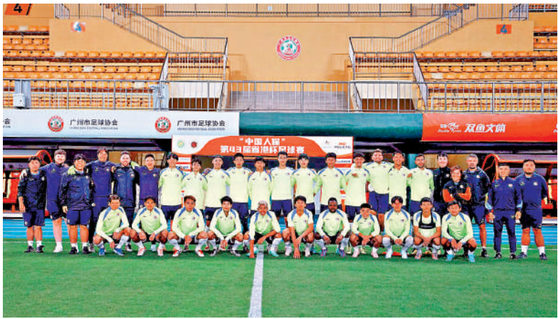
▲港足球員在越秀山體育場大合照。