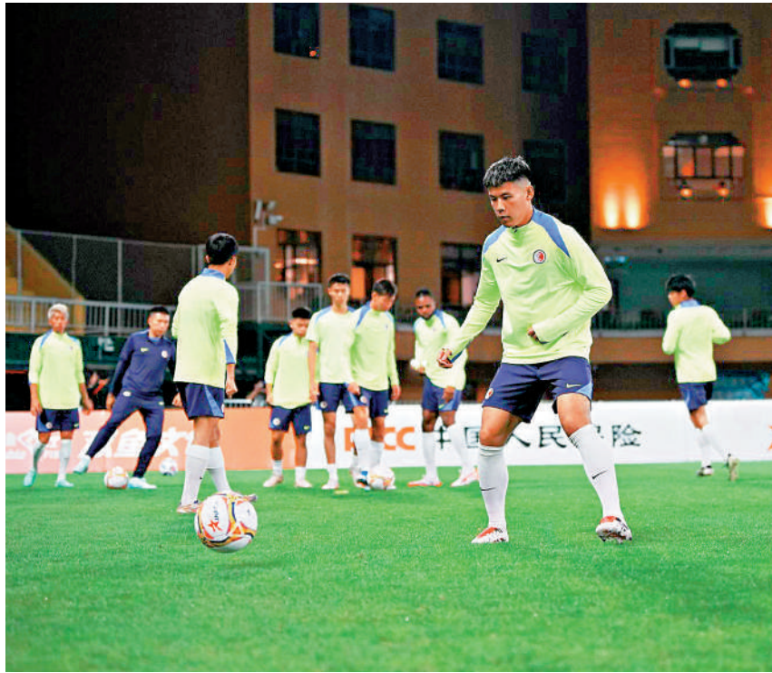
▲港足球員昨日在越秀山體育場備戰。

【大公報訊】記者朱家立報導：作為省港盃廣東隊主場及第十五屆全國運動會女子足球(U16)小組賽舉辦場地，越秀山體育場將於今天迎來翻新後的首場大型賽事，今仗亦是十五運會的測試賽之一。本次翻新主要集中於場館設計、舊場改造、智慧設施、惠民工程等方面，全面提升觀賽體驗並滿足賽事功能要求。 身為歷史悠久的足球場，越秀山體育場曾主辦過多項大型足球比賽，但場地急需改造以便符合全運會要求。本次翻新工程以四大方向為主，一是改進場館設計，例如在西看台增加「廣州越秀山體育場」的大型字體、重新設計場館Logo等。二是翻新現有設施，對原有的破舊跑道升級改造為現行國際時尚的藍色跑道，並於觀眾席座位採用漸變黃色、看台蓋罩採用灰色等。三是做好引入智慧化設施，如安裝可根據土壤水分數據信息和氣象信息實現分區灌溉的系統。至於燈光則升級為更高效節能的LED賽事照明以及智能照明系統。四是融合市民需求，例如在步行道新增配套智慧健身導引系統，市民步行經過智慧步道布點區域，毋須佩戴任何設備就可以查看自己的運動距離、運動時間、消耗熱量等數據。 另外，越秀山體育場於翻新後將對群眾免費開放，此舉能為周邊居民提供更好的健身惠民服務。