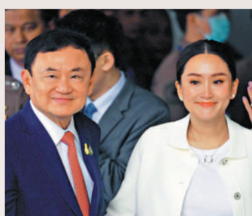
關兒 ▲泰國前總理他信和其女兒、現任泰國總理佩通坦都關注電騙事件。

泰國總理佩通坦昨日（15日）上午在主持2026財年預算政策會議上，首次公開分享了自己近期遭遇的一次電騙經歷，對方冒充東盟成員國領導人，試圖以「國家」名義請求捐款，令她險些受騙，希望藉此提醒公眾保持警惕，提高防騙意識。