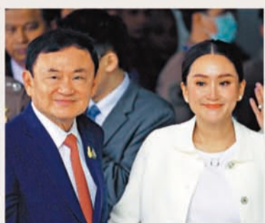
▲泰國前總理他信和其女兒、現任泰國總理佩通坦都關注電騙事件。

泰國總理佩通坦昨日（15日）上午在主持2026財年預算政策會議上，首次公開分享了自己近期遭遇的一次電騙經歷，對方冒充東盟成員國領導人，試圖以「國家」名義請求捐款，令她險些受騙，希望藉此提醒公眾保持警惕，提高防騙意識。