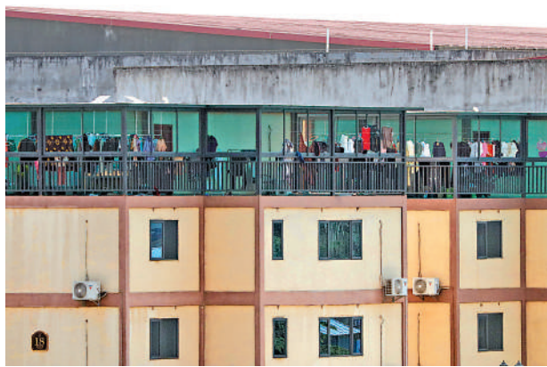
▲大公報記者日前在緬東妙瓦底亞大城拍攝到電騙園區宿舍情況。