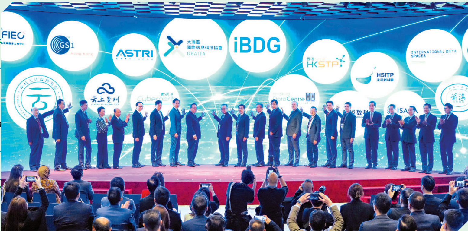
▲「推動數據要素流通、促進數字經濟新質生產力發展」峰會昨日舉辦。峰會上，國際數據產業聯盟正式成立，通過聚合產業內力量，建設香港成為國際數據港。