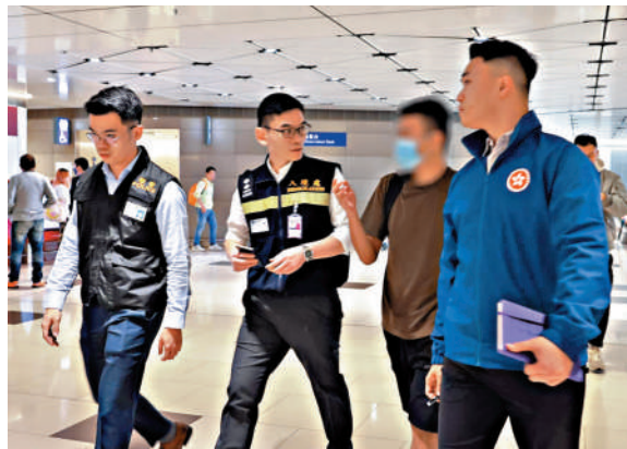
▲被禁錮緬甸的25歲男子昨日返港，由警方、入境處、保安局人員護送。