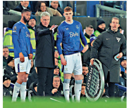
▲愛華頓領隊莫耶斯（左二）。

莫耶斯回巢執教愛華頓的首仗卻以落敗告終，被對方阿士東維拉射手奧尼屈堅斯下半場「一錘定音」，主場輸0:1遭連勝3連敗兼零入球。莫耶斯不滿球證巴洛治首先沒向對手阿馬度奧拿出示第2面黃牌，之後連士唐在客軍禁區內被推跌，球證亦沒有判罰12碼。