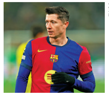
◀巴塞隆拿前鋒羅拔利雲度夫斯基。

踏入新年後開始轉好運4連捷的巴塞隆拿，明晨在新年首場西甲作客基達菲時，將有羅拔利雲度夫斯基、卡沙度、巴迪幾名前、中、後場球員復任正選，獲臨時註冊的丹尼爾奧莫或先居後備，現處下游的基達菲則有前鋒艾華路洛迪古斯和守將迪亞高歷高停賽，復甦的巴塞有力延續勝利走勢，可敲「讓球主客和」巴塞[-2]的讓和。