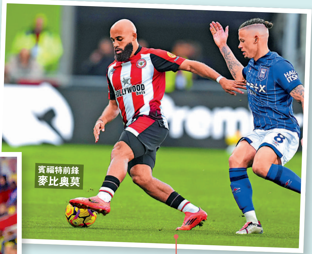
賓福特前鋒 麥比奧莫