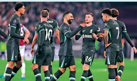
◀利物浦前鋒穆罕默德沙拿(右四)。