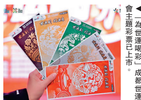
▲「為世運喝彩」成都世運會主題彩票已上市。

主題為「世運同行 好運連連」的5元面值彩票一套5張，票面以成都世運會會徽為主元素，將會徽與非遗竹編元素相結合，同時加入成都世運會運動項目元素，形成完整的主畫面，呼應世運會會徽的五種顏色：中國紅、公園綠、金沙黃、熊貓黑、雪山白。整體畫面時尚簡約。