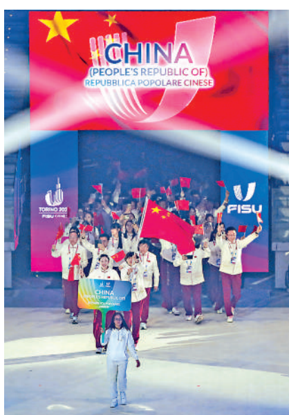
▲中國大學生體育代表團在開幕式上入場。

中國和意大利近幾年在冰雪運動領域的合作愈加密切。2021年，意大利以主賓國身份參加了在北京舉行的國際冬季運動（北京）博覽會；2022年，中國、意大利冰雪之緣冬奧主題展以線上、線下相結合的方式在北京和意大利米蘭同時舉行。萊昂表示，近年來，學習中文的意大利人數量顯著增加，其中也包括一些運動員，這將進一步推動兩國的交流。「意大利和中國在冰雪運動上一直保持着良好合作，這不僅局限於大學體育方面。」