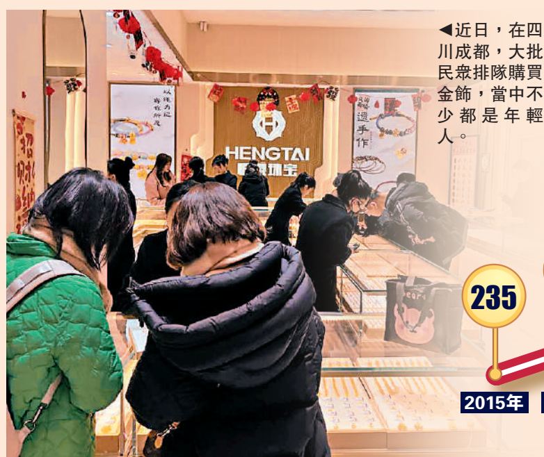
▲近日，在四川成都，大批民眾排隊購買金飾，當中不少都是年輕人。