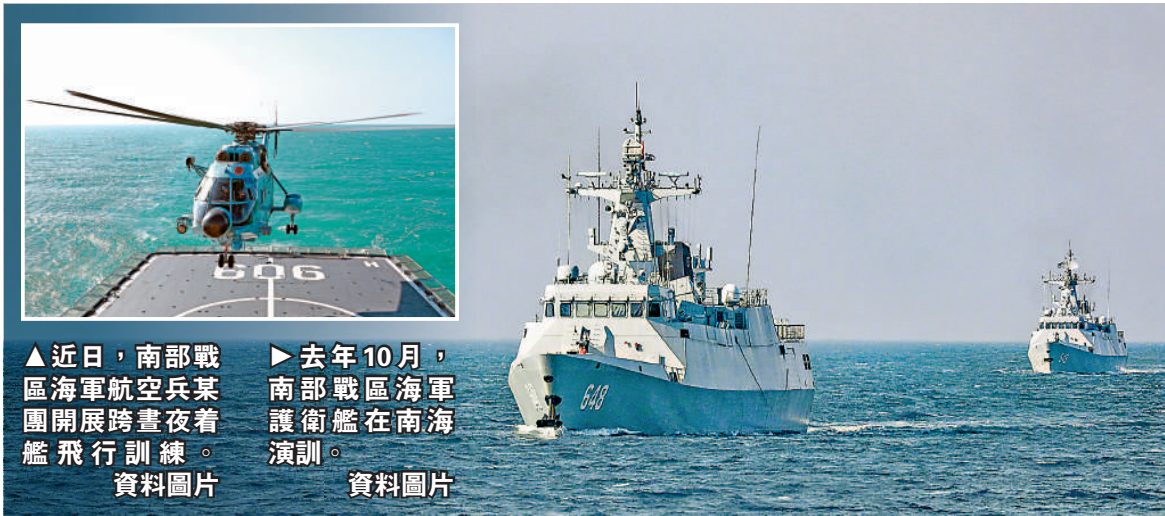
▲近日，南部戰區海軍航空兵某團開展跨晝夜着艦飛行訓練。資料圖片