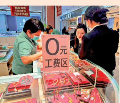
▲在北京某珠寶城，部分店鋪設有金飾「0工費」專區。

時。」曼珊珠寶店的店員表示。這家店舖在珠寶城人氣頗旺。店員提到，恰逢蛇年，店裏推出了不少融入蛇年元素的新品，如造型獨特的卷卷蛇、百靈蛇等金飾，一經推出便受到年輕消費者的熱烈追捧。