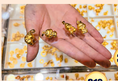
◀以蛇為造型的小型金飾受到消費者歡迎。