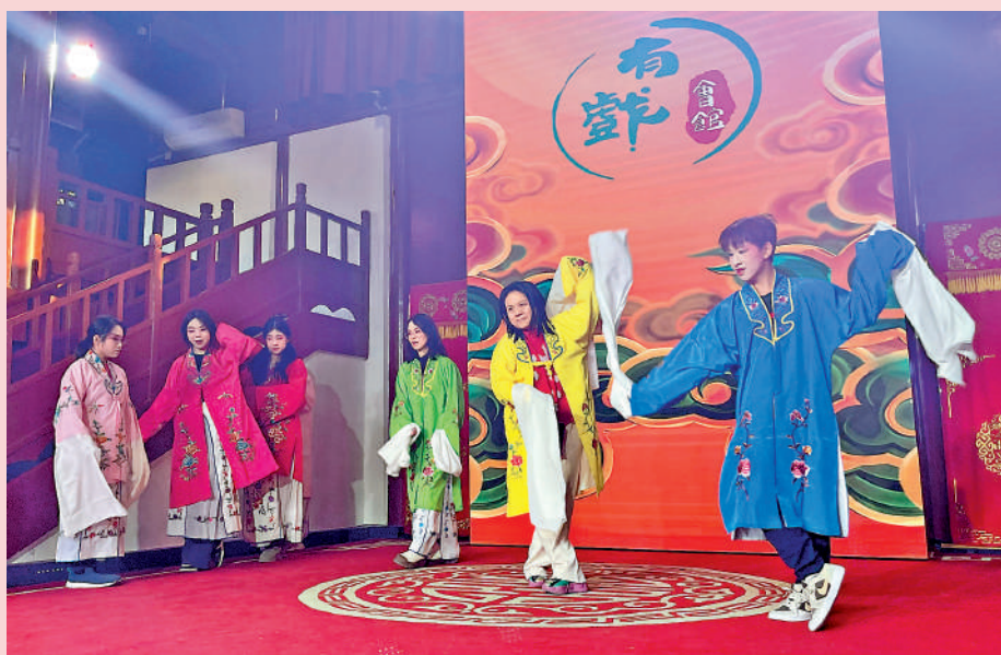
▲港人在顏料會館，全身扮相登台學京劇，親身感受戲曲的動作美和唱腔美。

走在前門三里河畔，小橋流水、鴨鳴水榭，令遊人恍惚是否誤入江南水鄉。前門三里河，因其距離正陽門三里地而得名，原來是老北京城護城河的洩水河道，精心改造後重現了從明朝時期就有的「水穿街巷」景象，有江南水鄉之風韻，也有老北京的胡同風情。經過多年整治，三里河周圍的胡同環境煥然一新，曾被評選為「首都文明街巷」。