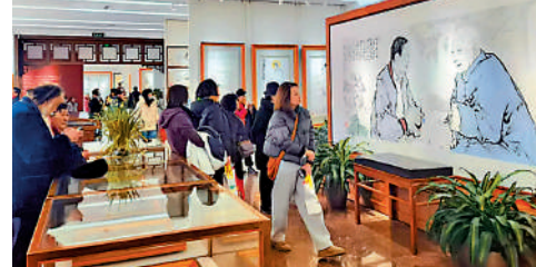
▲1月18日，「范曾乙巳年新春展」在北京榮寶齋舉行，吸引了大量參觀者駐足欣賞。

北京榮寶齋拍賣有限公司董事長兼總經理范存剛18日對大公報記者說，這次展覽的畫作都很精美，有的尺幅不大，但是筆墨語言表達非常充分，既有范先生過去的風格，同時又展現出新的氣象。