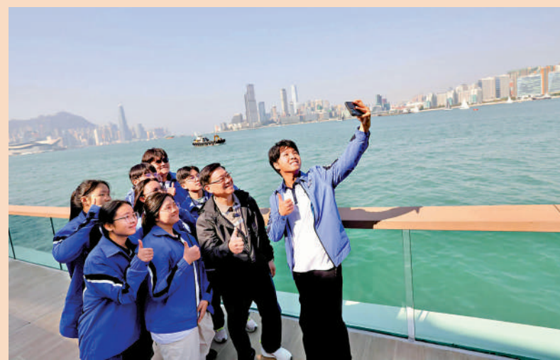
行政長官李家超相信板道開放後，定必成為市民另一「打卡位」，讓大家一同感受維港海濱的無限活力和魅力。