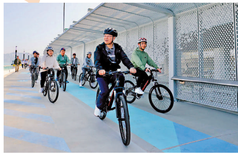
李家超昨日和一眾青年在東岸板道試踩單車。

「一板貫通，暢踏西東」。東岸板道全長約2.2公里，分兩階段完成。1月26日向公眾開放的西段是活力環島長廊的組成部分，長約1.1公里，包括700米連接東岸公園主題區至北角海濱花園的板道，以及400米經優化的北角海濱花園。至於餘下的北角至鰂魚涌的東段板道，發展局預計會於2025年下半年陸續開放，屆時將打通一條長約13公里連貫堅尼地城至筲箕灣的海濱長廊，駁通港島北岸海濱，這個新的海濱共享空間標誌着完成駁通港島北岸海濱的最後一塊拼圖。